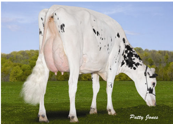
ONTOWA AUTHORITY PASTAS