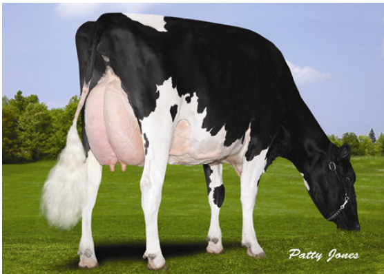
HYLANDAIRY AUTHORITY VERONA